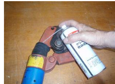
写真2：シリンダー部防錆処置