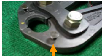
写真2: ダイス止めピン