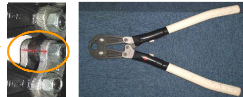
写真4: 出力確認時手鋏工具 写真